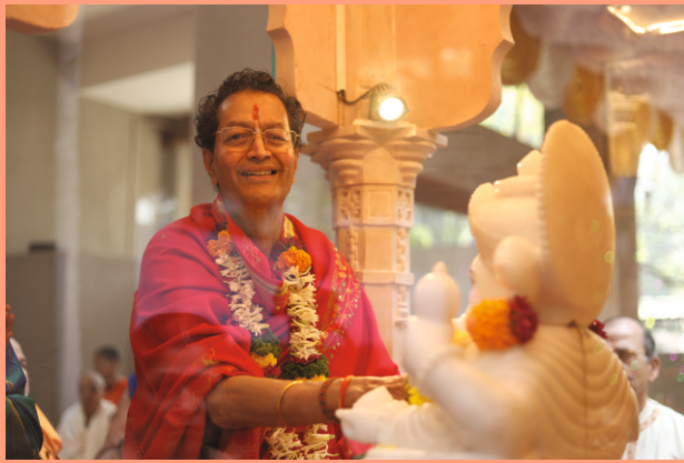
डोळे आले भरून आदिगणेश स्थापिता