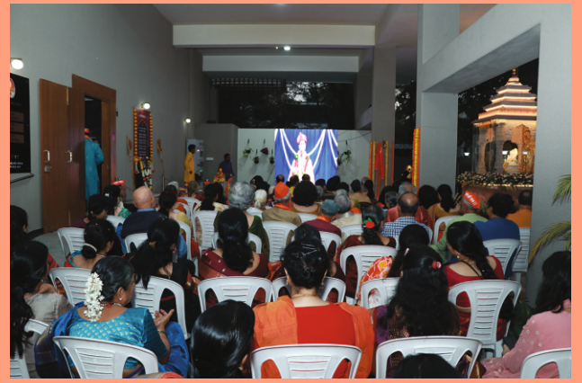
श्रीरामसोहळ्यासाठी सभागृहासह प्रांगणातही गर्दी उसळली होती.