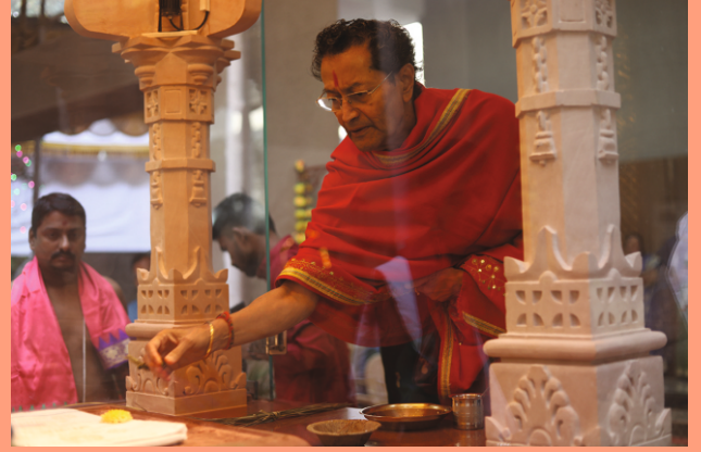
प्रतिष्ठापनेचे मंगल कार्य