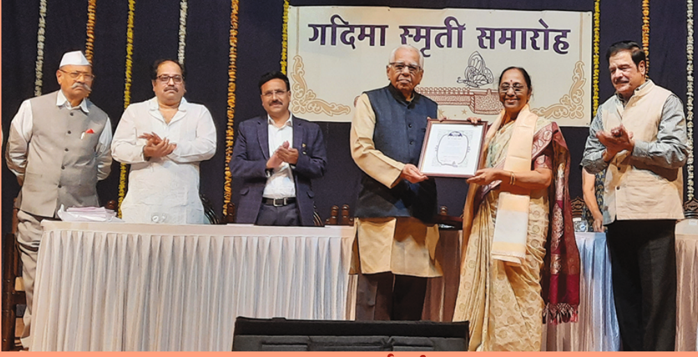
मानाचा पुरस्कार अपर्णाताईना प्रदान

'गृहिणी सखी सचिव पुरस्कार' आनंदसोहळा - दि. १४ डिसेंबर २०२३