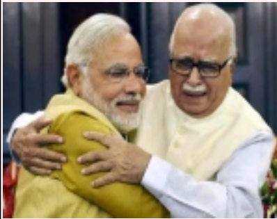
लालकृष्ण अडवाणी यांना भारतरत्न जाहीर. श्रीराम जन्मभूमीसाठी रथ यात्रा, आंदोलन करणाऱ्या रामभक्तांचा योग्य सन्मान