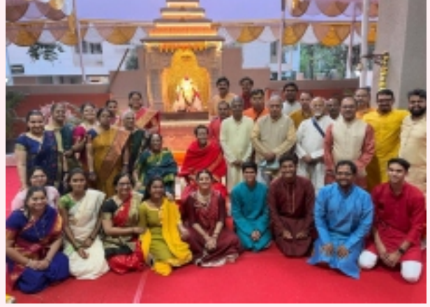
आदित्य प्रतिष्ठानच्या कार्यकर्त्यांसह गुरुदेवांना संकल्पपूर्तीचे समाधान!