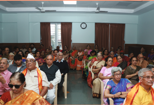
आदित्य प्रतिष्ठानचे नूतन सभागृह भाविकांनी भरून गेले.